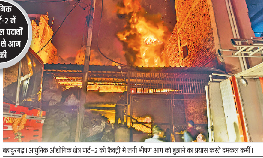
बहादुरगढ़। आधुनिक औद्योगिक क्षेत्र पार्ट-2 की फैक्ट्री में लगी भीषण आग को बुझाने का प्रयास करते दमकल कर्मी।

फैक्ट्रियों में जूता-चप्पल, प्लास्टिक दाना और थर्माकोल दाना आदि तैयार किया जाता था। बड़ी मात्रा में प्लास्टिक, रबर और अत्यंत ज्वलनशील केमिकल मौजूद होने के कारण आग लगातार भड़कती रही। मौके पर बहादुरगढ़, रोहतक, सोनीपत व झज्जर सहित अन्य इलाकों की एक दर्जन से ज्यादा फायर ब्रिगेड की गाड़ियां आग बुझाने में जुटी रही। दमकल कर्मचारियों को कड़ी मशकत करनी पड़ रही है, लेकिन रसायनों की वजह से आग पर काबू पाना मुश्किल साबित हो रहा है।