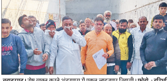
बहादुरगढ़। रोष व्यक्त करते अंडरपास में एक लाइनपार निवासी।

शहर के अंडरपास की लगातार खराब होती स्थिति को लेकर स्थानीय लोगों का धैर्य अब जवाब देने लगा है। वीरवार सुबह बड़ी