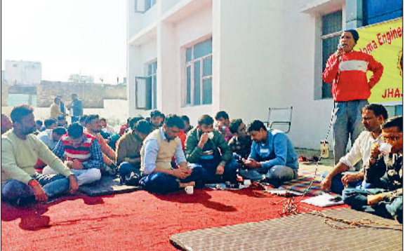
झज्जर। हड़ताल के दौरान नारेबाजी करते कनिष्ठ अभियंता।