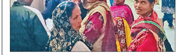
बहादुरगढ़। नेत्र विभाग में जांच कराने आए लोग।