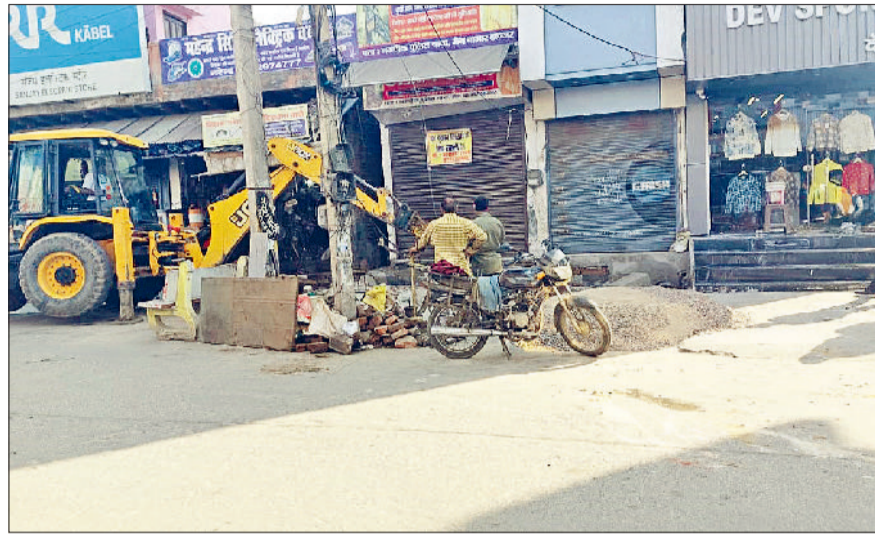
झज्जर। नाला निर्माण के लिए खुदाई कार्य में लगी जेसीबी।

कुछ दुकानदार खुद ही दुकान की सीढ़ियां तोड़ते नजर आए