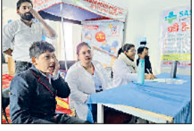
झज्जर। नेत्रांच कैंप में शामिल विद्यार्थी एवं चिकित्सक।