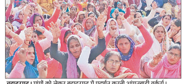
बहादुरगढ़। मांगों को लेकर बहादुरगढ़ में प्रदर्शन करती आंगनबाड़ी वर्कर्स।