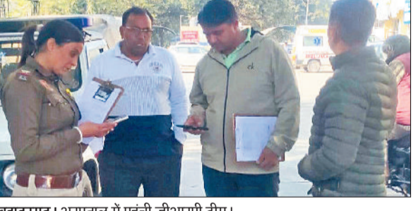
बहादुरगढ़। अस्पताल में पहुंची जीआरपी टीम।

मृतक युवकों की नहीं हो पाई पहचान, जीआरपी ने शव नागरिक अस्पताल के शवगृह में रखवाए