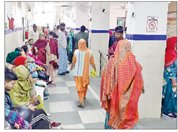
झज्जर। नागरिक अस्पताल की ओपीडी में लगी लोगों की भीड़।

पीजीआई रोहतक व वर्ल्ड कॉलेज के चिकित्सकों को बुलाकर करवाया जा रहा मरीजों का इलाज